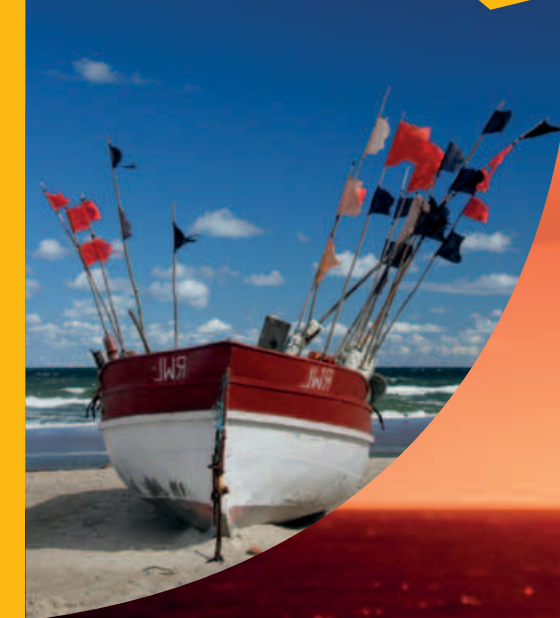
Gestaltung: SEGRA GmbH, Neustadt i. H.